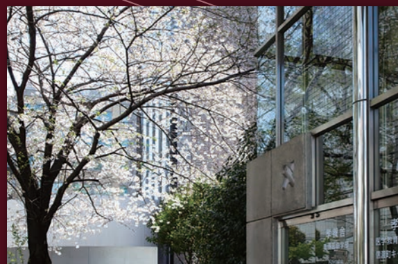
信濃町キャンパス・孝養舎