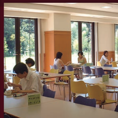
湘南藤沢キャンパス・ 学生ラウンジ