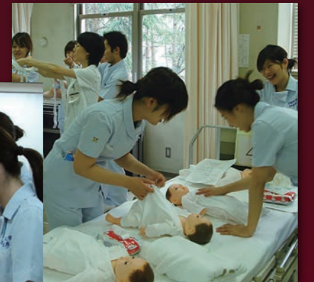
小児看護学演習（3年生）