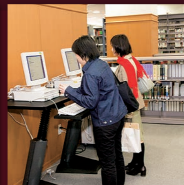
湘南藤沢キャンパス・ 看護医療学図書室