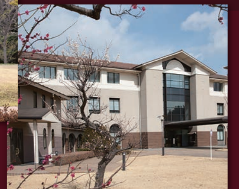
湘南藤沢キャンパス・ 看護医療学部校舎