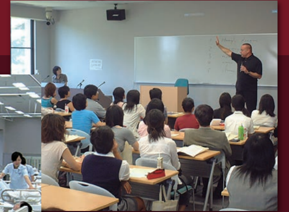
2001年 湘南藤沢キャンパス 授業風景