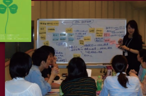
三学部合同後期教育 ケースディスカッション