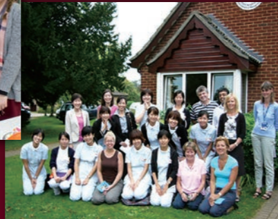
「世界の医療保健制度Ⅱ」英国研修 子どもホスピスにて