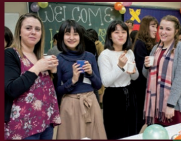
2017年 短期留学生受入プログラム開始