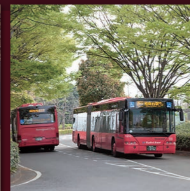
湘南藤沢キャンパス・ 連結バス