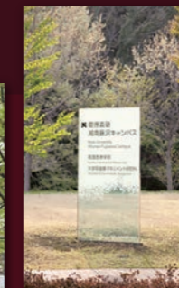
湘南藤沢 キャンパス・ サイン